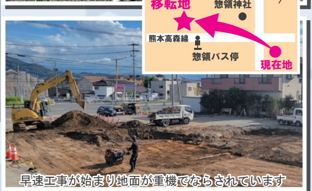
移転地 惣領神社 熊本高森線 惣領バス停 現在地