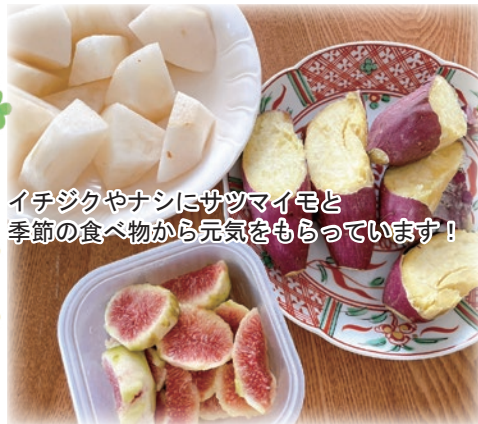
イチジクやナシにサツマイモと季節の食べ物から元気もらっています！

中でもハマっているのは無花果（イチジク）で、実家の庭に父が植えており、食べるうちに好きになりました。